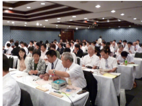
セミナー参加者の様子